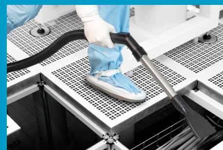
Outil manuel spécial pour le nettoyage sous plancher technique inclus

Pour plus d'informations sur notre produit, visitez : i-teamglobal.com