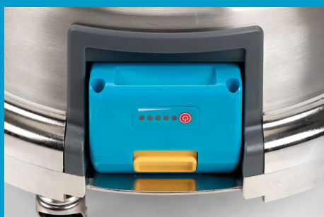
Machine alimentée par batterie